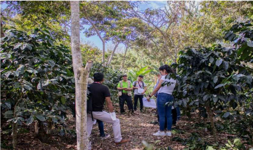
MIDAGRI (misión tecnológica) Comisión Técnica Regional de Café 2018