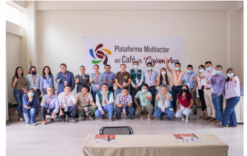
Comité Coordinador Miembros de la PMACC 2021 - 2022