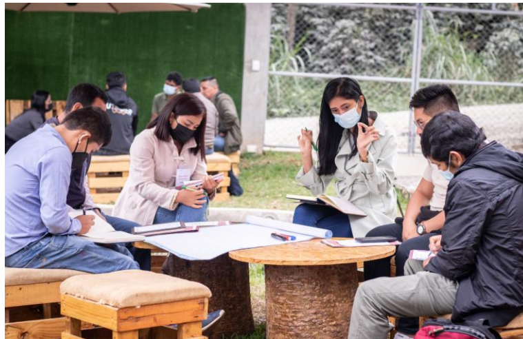
Diálogos articulados entre los actores Proceso de construcción PMACC - 2019 - 2020